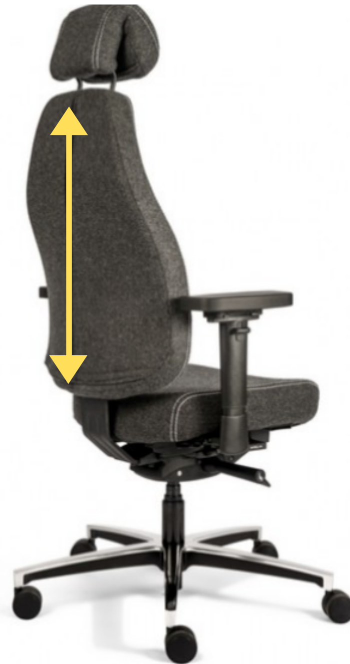
6. Réglage de la hauteur du dossier sur 7 clics